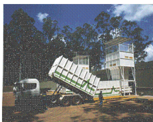
Transferencia y transporte. Estación Posadas.