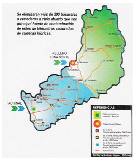
Esquema Regional de Estaciones de Transferencia. Fuente: AESA Misiones.